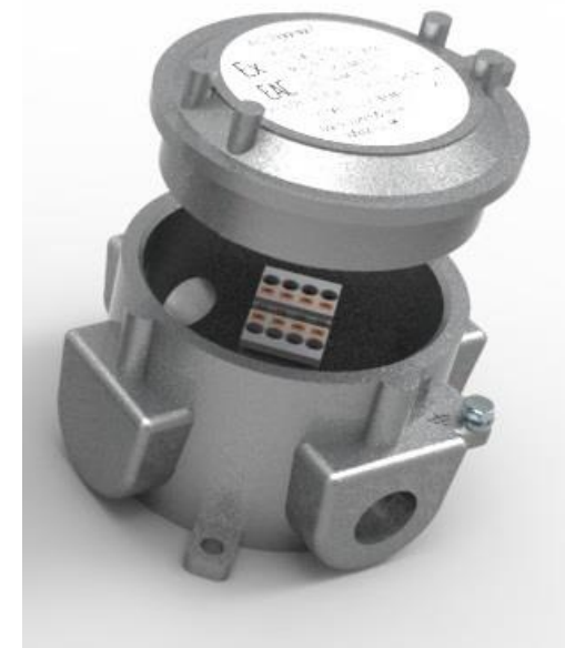
KVC-01-2-G1/2"-3 KVC-01-2-G3/4"-3 KVC-01-2-M25x1,5-3

Коробка предназначена для применения во взрывоопасных зонах 1 и 2, категории II по подгруппе взрывоопасных газовых сред IIA, IIB, IIC, категории III по подгруппе взрывоопасных пылевых сред IIIA, IIIB, IIIC на предприятиях ПАО «Газпром», АЭС и других предприятиях газовой, нефтяной, нефтехимической, химической и других отраслях промышленности.