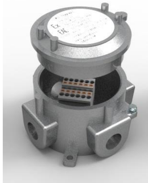
KVC-01-3-G1/2"-6 KVC-01-3-G3/4"-6 KVC-01-3-M25x1,5-6